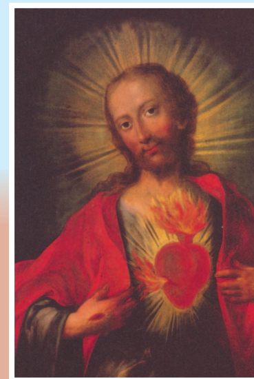
Heiligstes Herz Jesu, erbarme Dich unser!