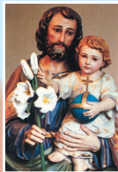
Sankt Josef, du mein Schutzpatron.

Und so besuchte er ab dem zehnten Lebensjahr